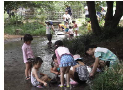
野川に流れ込む湧水ひろば